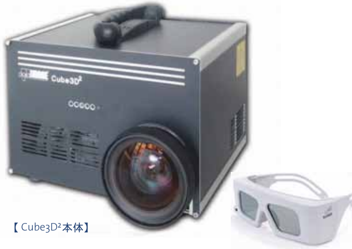
【Cube3D 2 本体】

Cube3D 2 は1台で簡単に立体視を実現。 スクリーン不要で壁にそのまま映して 立体視！