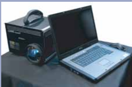
17インチ立体映像出力用ノートパソコン

★Cube3D 2 での立体表示には下記製品との併用が大変便利です。 専用のスクリーンが不要のため、このセットだけで立体視の環境を実現できます。